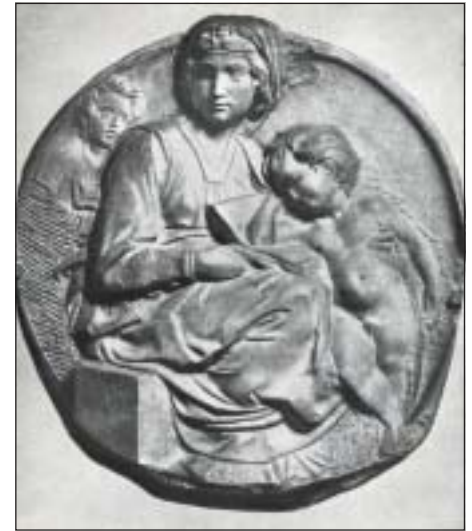
Michelangelo – Pitti Madonna