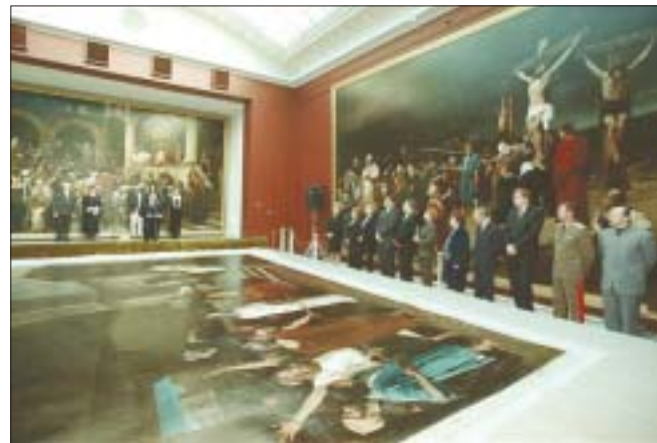
A Kanadától Debrecenig tartó légi úton a -40 fokra fagyott képet egy éjszakán át hagyták teremhőmérsékletűre melegedni, és csak ezt követően göngyöltették ki a szakemberek a Déri Múzeumban

◆ A kanadai Hamilton Galéria képviselői december 12-én Debrecenben hivatalosan átadták Munkácsy Mihály Krisztus Pilátus előtt című festményét a Déri Múzeumnak. A kép a letéti szerződés értelmében legalább 2008-ig Debrecenben marad. Az alkotást január első napjaiban állítják föl a múzeum Munkácsy-termében, így hosszú idő után újra együtt lesz látható a Munkácsy-trilógia, vagyis az 1881-ben készült Krisztus Pilátus előtt, az 1884-es keletkezésű Golgota és az Ecce Homo!, amit Munkácsy 1896-ban festett. A Krisztus Pilátus előtt című alkotást tavaly októberben azért szállították Debrecenből a tengerentúlra, hogy kanadai tulajdonosa az ottani törvényeknek megfelelően ajándékozhasssa a festményt a Hamilton Galériának. A jelenleg is Debrecenben látható Golgota megvásárlásáról a magyar állam még tárgyal a festmény amerikai tulajdonosával.