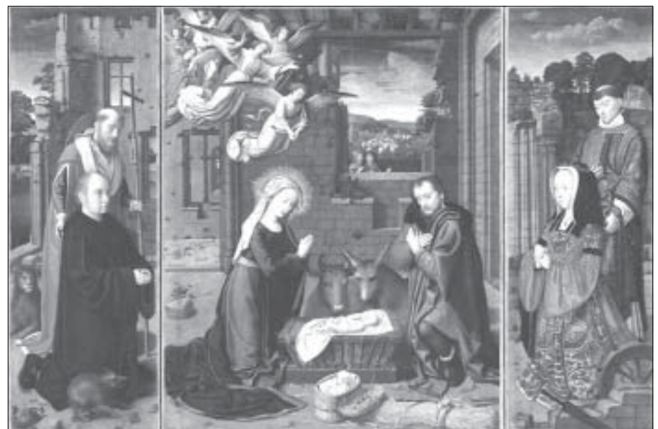
Gerard David festménye

Rózsa elhervad márvány hasad, a hűségem kire marad?