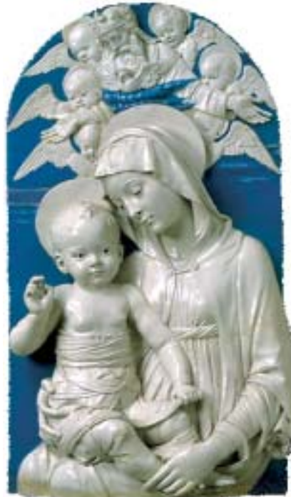
Andrea della Robbia: Mária és gyermeke

Ha szűk szoba: hadd legyen szűk szoba. A szűk szobában is terem öröm, Gyúl apró gyertya ínség idején, Oh csak ne legyen sorsom bús közöny, Oh csak legyek a fény forrása én, Apró gyermekek bálványozott fája, Én az idegen, én a jövevény, Égő fenyőfa, égő áldozat, Akit az Isten ősi otthonából Emberek örömeire elhozat. Csak rajzolódjék mélabús árnyékomból Imbolyogjon a szűk szobák falán, Minddegy, hogy mi lesz velem azután.