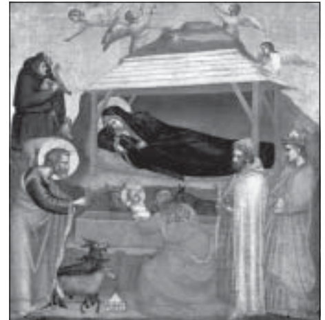
Giotto di Bondone festménye