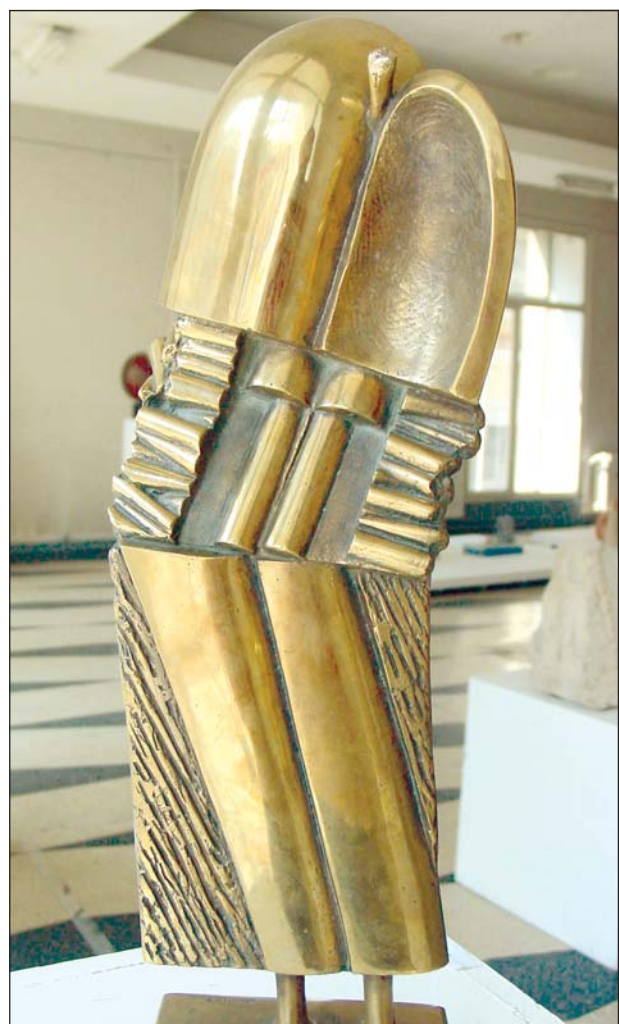
Szakáts Béla: Celestine