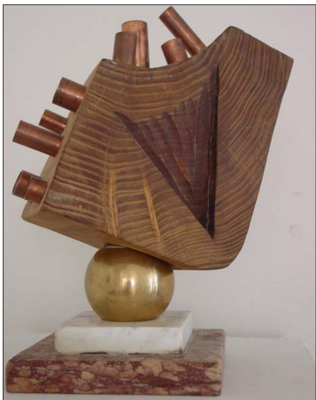
Baciu Călin: Kompozíció